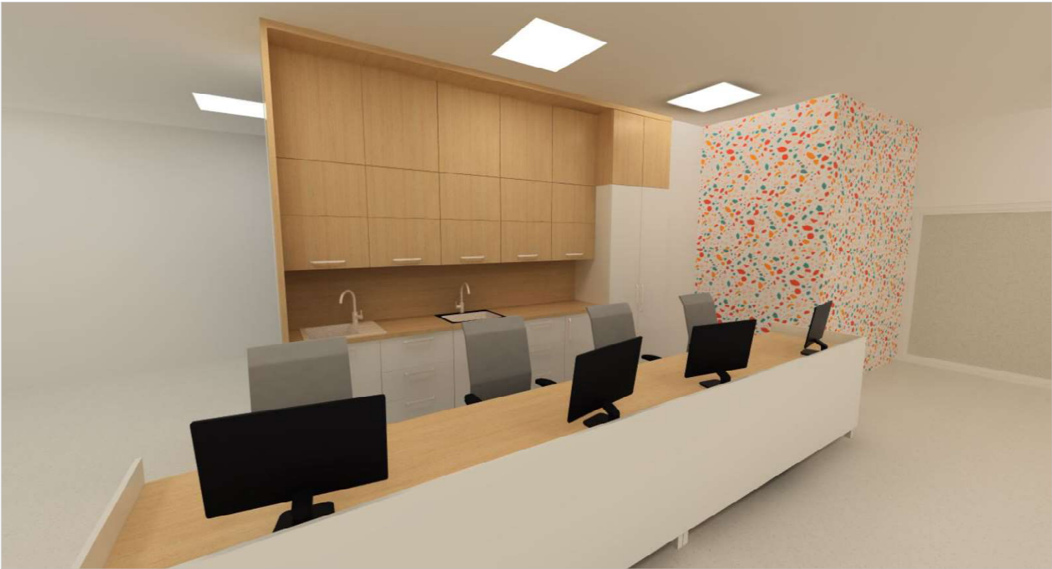
m. č. 598